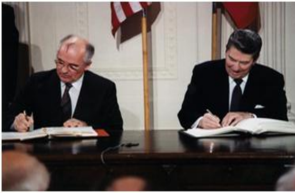
1986г (Горбачев; Рейган)