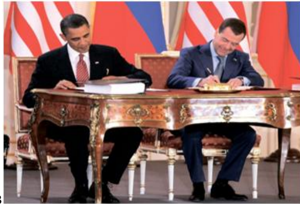
Указать участников, подписавших Договор СНВ (Медведев; Обама)