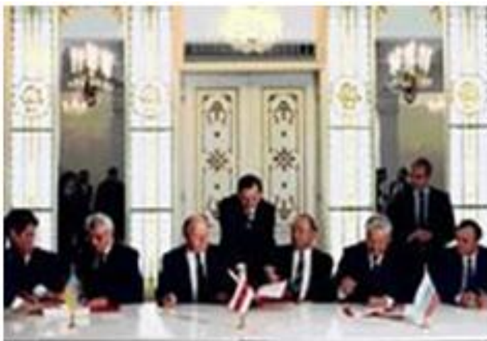
(Ельцин; Шукшевич; Кравчук)