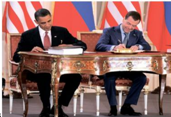
Указать участников, подписавших Договор СНВ (Медведев; Обама)