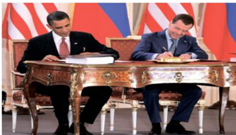
Указать участников, подписавших Договор СНВ (Медведев; Обама)

3.2. Соответствие между бальной системой и системой оценивания по результатам тестирования устанавливается посредством следующей таблицы: